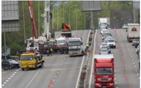
SAVOIE Accident mortel de la VRU à Chambéry : le logisticien relaxé