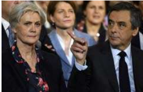
ENQUÊTE Comment Penelope Fillon cumulait-elle deux temps plein ?