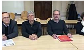
LE DAUPHINÉ LIBÉRÉ Les élus inquiets interpellent la ministre