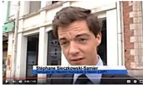
LE DAUPHINÉ LIBÉRÉ Elu plus jeune maire de France en 2014, mis en examen en 2017