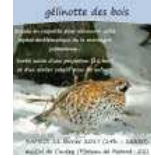
Balade découverte sur la gélinotte des bois