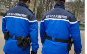
ISÈRE St-Laurent-du-Pont : un homme en BMW a tenté d'enlever un enfant