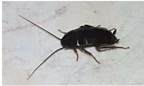
LE DAUPHINÉ LIBÉRÉ Un cafard lui trottait dans la tête